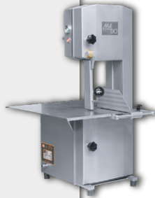
Serra Ossos MADO