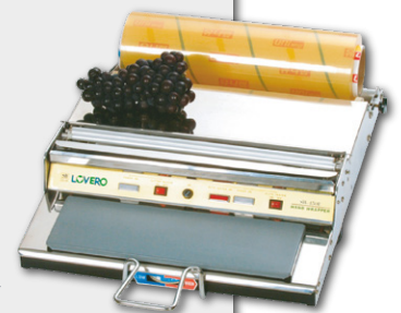
Máquina de Embalar Manual