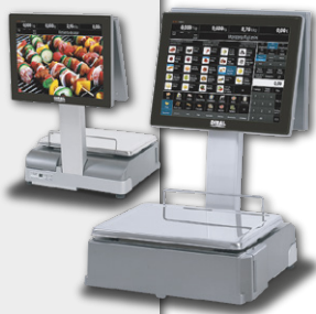
Balanças de Livre Serviço DIBAL