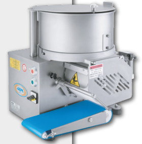
Formadoras de Hambúrgueres ABM