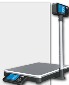
Balanças de Checkout DIBAL