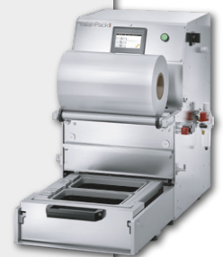
Termoseladora Manual ITALIAN PACK