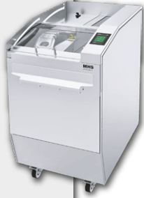
Fatiadoras de Pão MHS