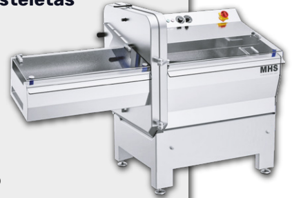
Corta Costeletas MHS

halfrut by TECHNOVAL MECHANICAL COMPONENTS