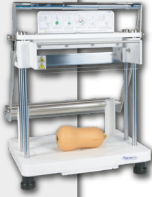
Fatiadora de Frutas e Legumes HALFRUT

halfrut by TECHNOVAL MECHANICAL COMPONENTS