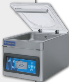
Máquinas de Embalar a Vácuo HENKOVAC