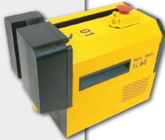
Afiadores de Facas