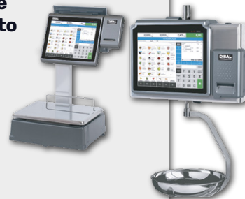
Balanças de Atendimento DIBAL