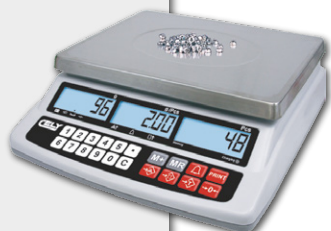
Conta Peças CELY