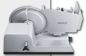
Fatiadoras Manuais GRAEF