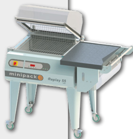
Máquina de Embalar em L MINIPACK