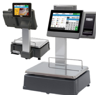
CS-2150 Duplo Corpo