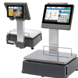
CS-2155 Duplo Corpo