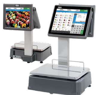
CS-2155 Duplo Corpo